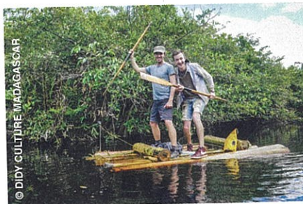
▲ Deux hommes sur un radeau.

Sud-Est de l'île, le maire d'Ampasimanjeva les accueille à bras ouverts et les jeunes du village leur donnent un coup de main pour construire leur radeau en bananiers. En moins d'une journée, ils sont prêts à partir mais apprennent que des crocodiles ont été repérés... Pour éviter tout problème, le maire les fait accompagner d'une pirogue qui transportera matériel et nourriture. Leur radeau n'est pas facile à manier : ils mettront trois jours à descendre les 35 kilomètres qui les mènent à l'océan. Le plus compliqué a été de gérer leur peur des « crocos » ! De retour en France, ils reviennent chargés de souvenirs de belles rencontres : deux vazahas (« blancs » en malgache) qui paiaient, ça étonne et ça crée des moments de partage, de bonne humeur et de fous rires.